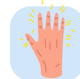
بیماری های پوست و دهان