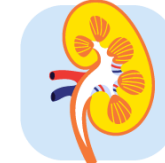
ناراحتی های کلیوی (Nephropathy نروپاتی)