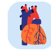
بیماری قلبی و عروقی